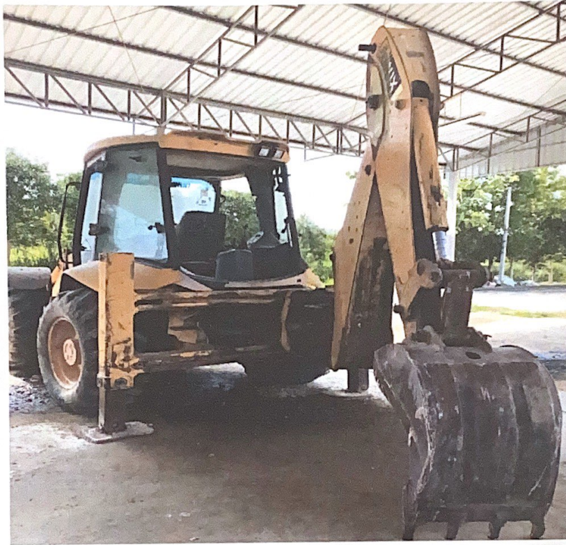
รถตักหน้าชุดหลัง JBC รุ่น 4Cx หมายเลขทะเบียน ตค 573